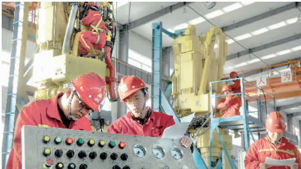
辽河油田天意石油装备有限公司,工人们正在组装调试设备。

行业通过创新强化基础、消化过剩,不断增强内生增长动力,结构调整效果逐步显现。随着稳增长政策措施的逐步实施,“一带一路”等战略推进,装备制造业经济运行进一步向好依然可期