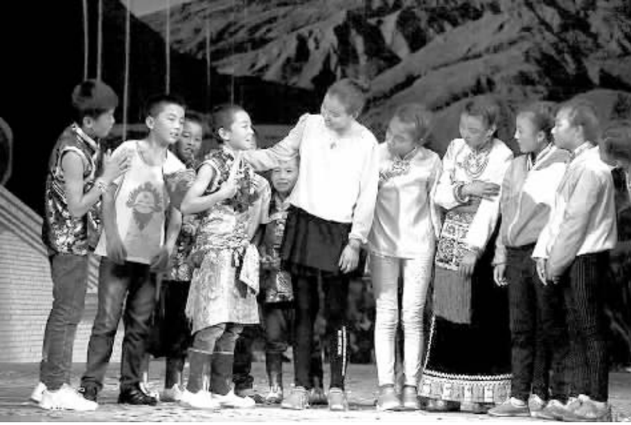
图为《热梦科巴》首演现场。