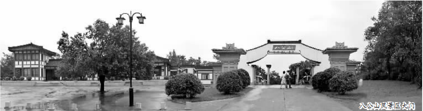
八公山风景区大门