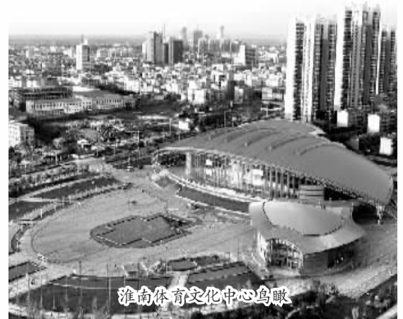
淮南体育文化中心鸟瞰

实施专业技术人才知识更新工程,到2020年,全市专业技术人才总量达到10万人以上,为煤炭、电力、化工、机械、医药等支柱产业培养相关高端人才5000人,为各类园区、产业园区培养相关专业技术人才3000人,实施高层次经营管理人才培养工程,提升创新创业水平。实施高技能人才培训工程,加快市职业院校和“淮南技师学院”建设步伐,建设一批公共职业训练基地和高技能人才培训基地,到2020年,全市高级工以上的高技能人才达到60000人,其中技师、高级技师达到8000人,高技能人才占技能队伍总数的30%左右。实施高端人才集聚工程,加快重点学科、重点实验室、院士工作站、博士后工作站建设步伐,深入推进“50·科技之星”创新团队建设,到2020年,全市新增院士工作站、博士后工作站6个以上,重点资助建设50家创新团队。建立健全人才激励机制,鼓励大众创业、万众创新。