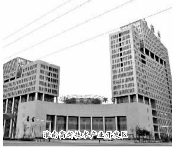
淮南高新技术产业开发区

淮南经济技术开发区重点发展现代装备制造和现代医药产业;淮南高新技术产业开发区重点发展新一代信息技术、现代装备制造、光电新能源、现代医药等四大产业;安徽(淮南)现代煤化工产业园重点发展煤基石油化工、替代燃料、基础化工及高端石化产品。推动淮南经济技术开发区创建国家产城融合示范区、淮南高新技术产业开发区创建国家开发区、安徽(淮南)现代煤化工产业园创建国家煤化工产业基地。到2020年,把园区打造成战略性新兴产业集聚发展和产业转型升级的主要平台,全市园区工业增加值占全市工业增加值比重超过50%、高新技术产业产值占园区工业总产值比重超过50%。