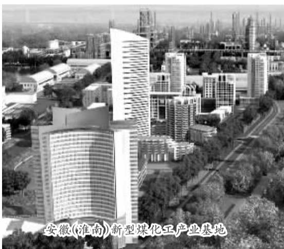
安徽(淮南)新型煤化工产业基地

人均主要经济指标在全省的位次进一步提升,人均地区生产总值力争达到1万美元(按目前汇率)。城乡居民收入与地区生产总值同步增长,人均收入达到全国平均水平。基本公共服务水平进一步提高,在全省率先全面建成小康社会。