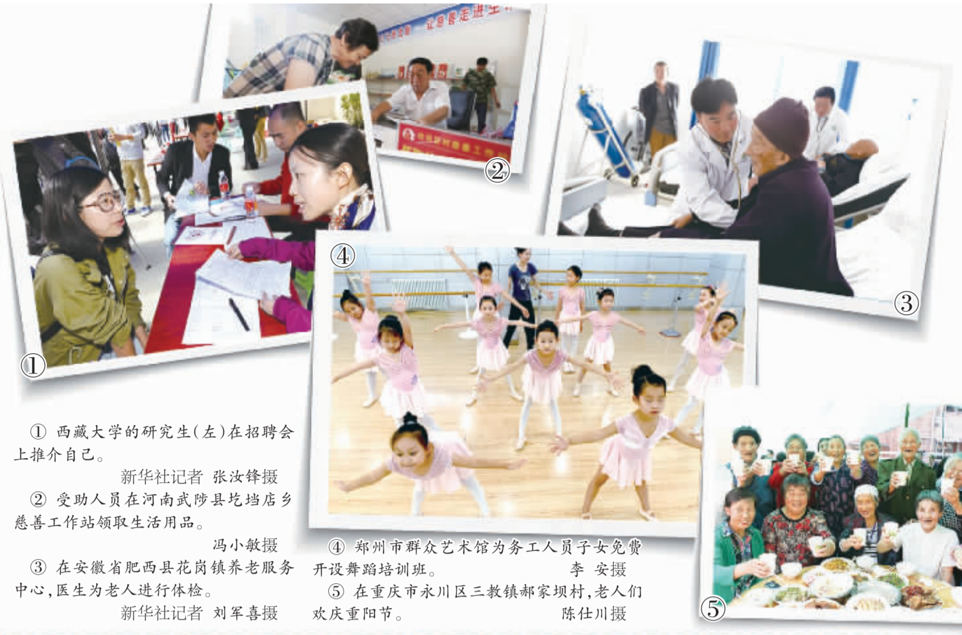
① 西藏大学的研究生(左)在招聘会上推介自己。 ② 受助人员在河南武陟县坑塘店乡慈善工作站领取生活用品。 ③ 在安徽省肥西县花岗镇养老服务中心，医生为老人进行体检。 ④ 郑州市群众艺术馆为务工人员子女免费开设舞蹈培训。 ⑤ 在重庆市永川区三教镇邮家坝村，老人们欢庆重阳节。

编者按 民生之本，本固邦宁。“十二五”时期，特别是党的十八大以来，党中央、国务院坚持发展和民生优先的方针，着力解决好人民群众最关心、最直接、最现实的利益问题，努力实现学有所教、劳有所得、病有所医、老有所养、住有所居，持续增加民生投入，不断出台更加细致具体的惠民举措，一项项惠民、保基本的民生保障安全网不断织大、织密，受益人群越来越广。展望“十三五”，民生工作将继续得到加强和改善，人民生活水平和质量将不断提高，以民生为重点的社会建设将推进到新阶段。要按照“四个全面”的战略布局，始终把实现好、维护好、发展好最广大人民群众的根本利益作为一切工作的出发点和落脚点，让发展成果更多更公平地惠及全体人民，让广大群众生活得更加美好和幸福。