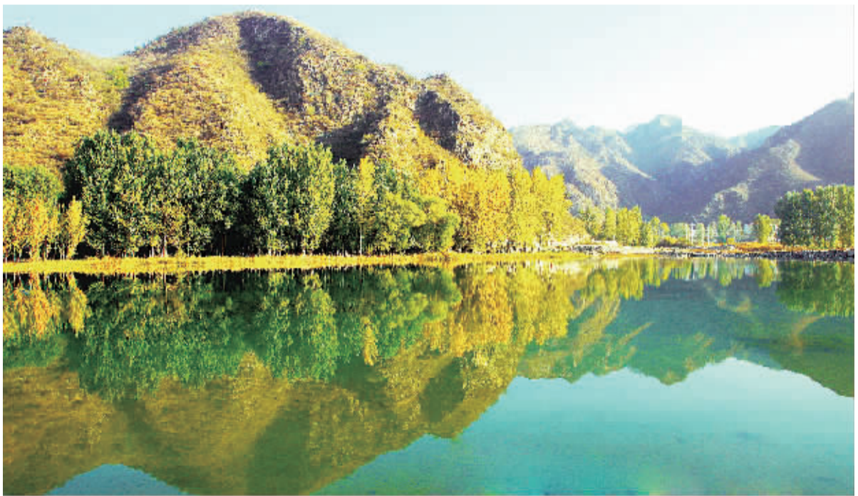
图为国家森林公园、河北涞水县野三坡风景区百里峡风光。野三坡地处太行山与燕山交界处,具有丰富的旅游资源,是融山泉水洞、林木花草、鸟兽鱼虫、文物名胜、民俗民情为一体的综合性自然景观整体。百里峡景区2006年被联合国教科文组织批准为世界地质公园,今年2月被国家旅游局、环境保护部审定为国家生态旅游示范区。

世界的未来属于年轻一代。全球青年有理想、有担当,人类就有希望,推进人类和平与发展的崇高事业就有源源不断的强大力量。希望各国青年用欣赏、互鉴、共享的观点看待世界,积极推动构建人类命运共同体添砖献瓦。 预祝本届青年论坛圆满成功! (新华社北京10月26日电)