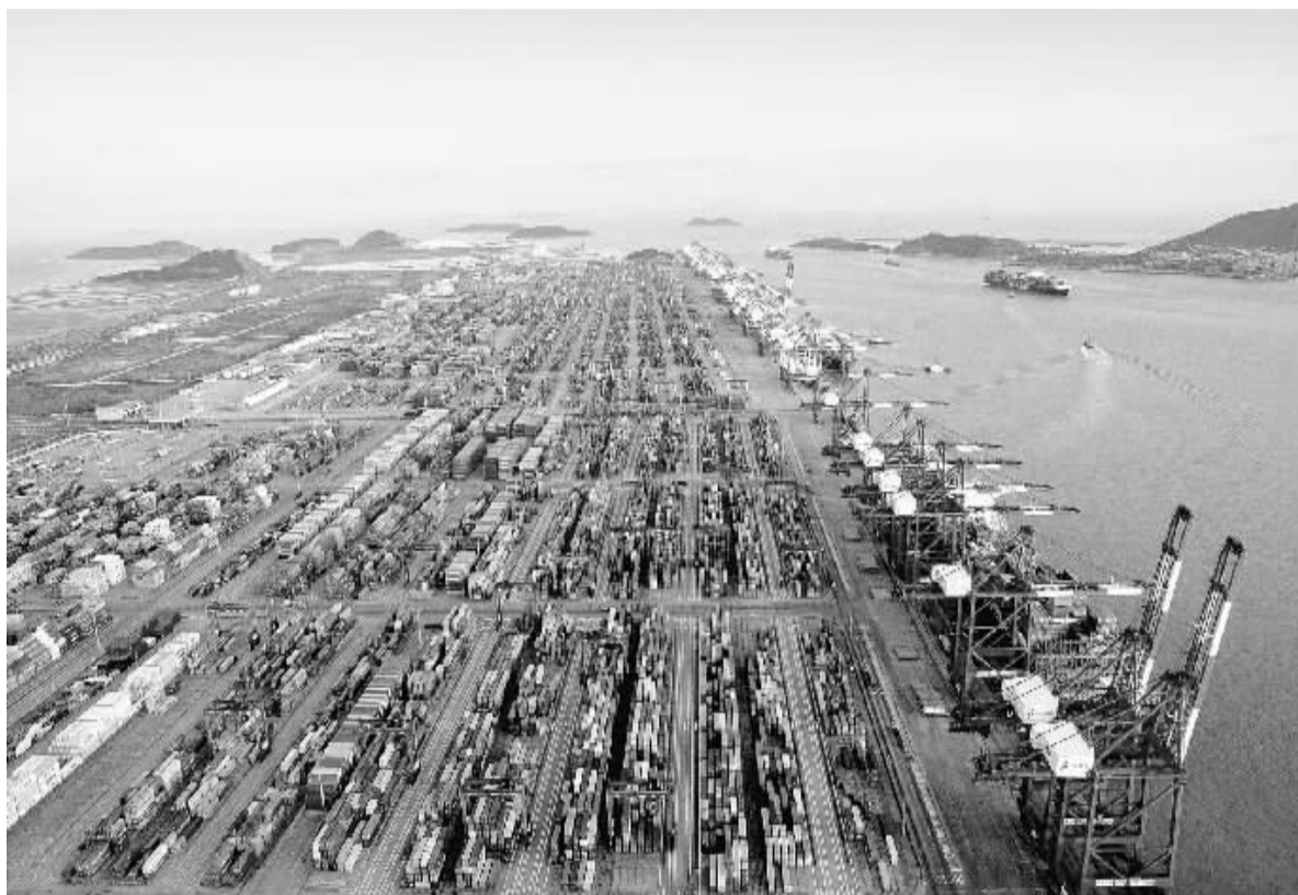
图为10月16日航拍的上海国际航运中心洋山港集装箱码头。近年来,上海全力打造建设国际航运中心新坐标——洋山深水港区,增强上海服务长江流域、连接世界和通达全球的能力。目前,上海港集装箱吞吐量已连续五年位居全球第一,国内首个全自动化集装箱码头已在上海国际航运中心洋山深水港区开工建设,到2017年建成时,年吞吐量将突破4000万标准箱。

万人、4561万人、3667万人、4478万人、4703万人。新型农村合作医疗覆盖面不断扩大。2014年末,参加新农合人数达到4965万人,比2010年末增加350万人。此外,国家还统一了城乡居民基本养老保险制度,不断提高企业退休人员基本养老金水平,全面启动机关事业单位养老保险制度改革。