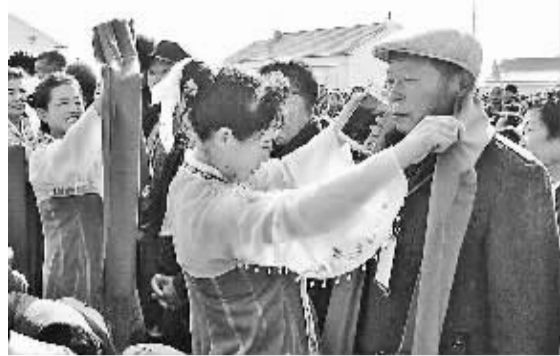
10月21日是农历重阳节,辽宁省昌图县举办了“温情重阳日 九九念亲恩”等一系列敬老爱老活动,图为当天工作人员在为老人送围巾中。