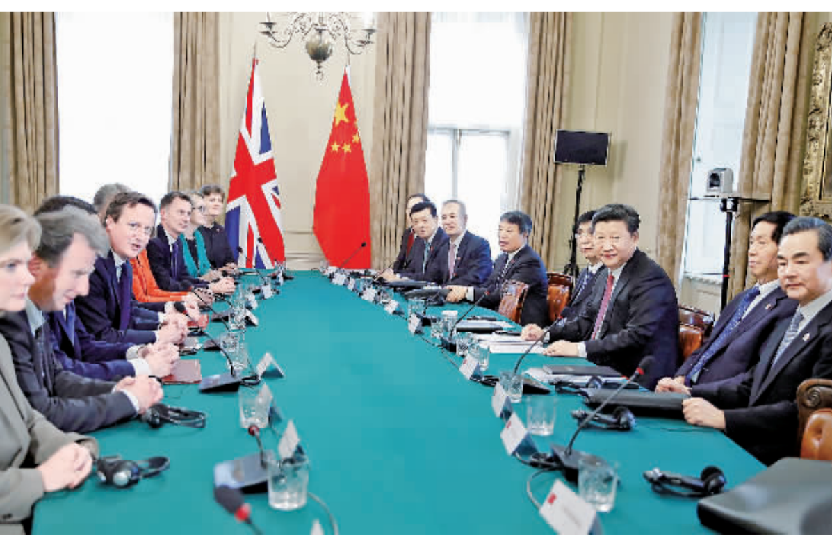
10月21日,国家主席习近平在伦敦唐宁街首相府同英国首相卡梅伦举行会谈。

双方同意在更大范围、更高层次上深化互利合作。双方同意提升两国贸易水平,加强在金融、基础设施