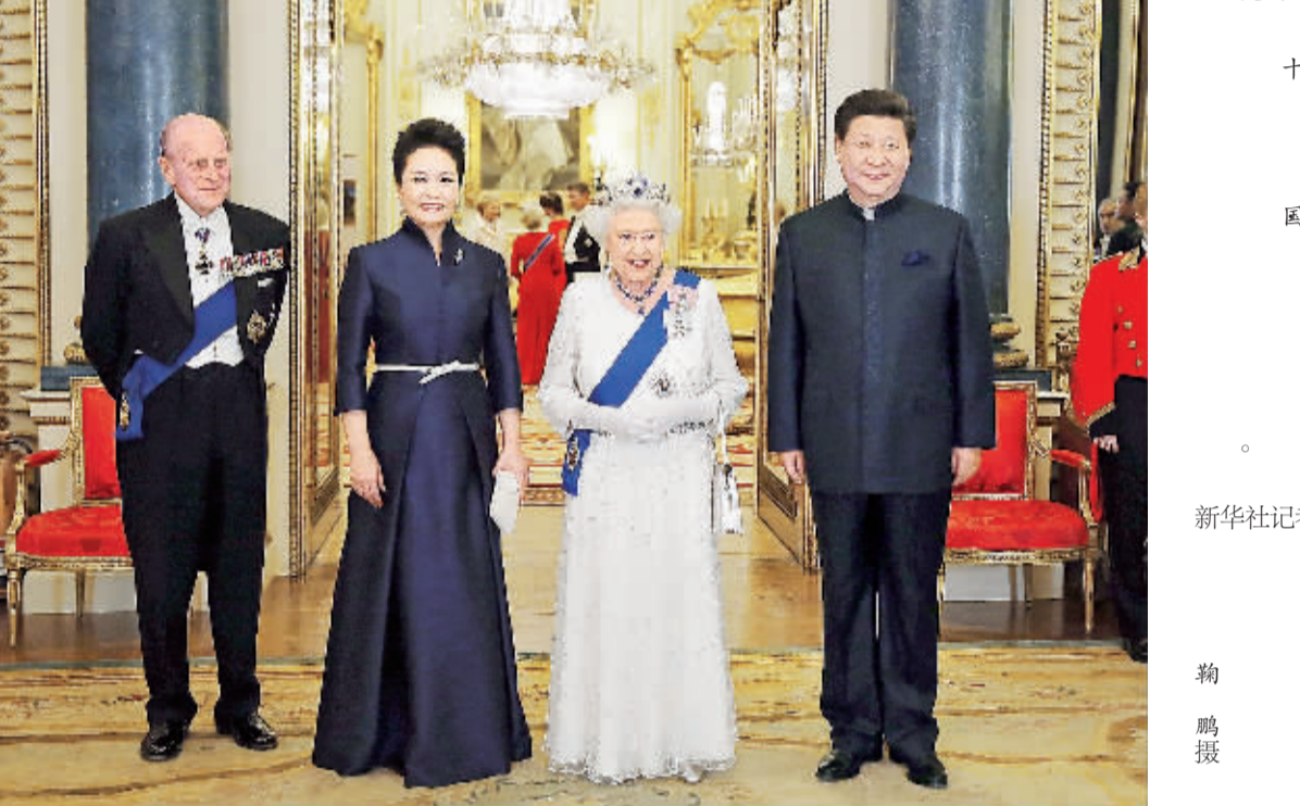
白金汉宫内灯光璀璨,鲜花绽放。习近平和彭丽媛受到伊丽莎白二世女王和丈夫菲利普亲王以及威廉王子夫妇、安妮公主、安德鲁王子、爱德华王子等王室成员热情迎接。(下转第二版)