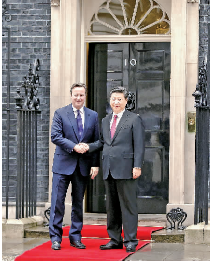
10月21日,国家主席习近平在伦敦唐宁街首相府同英国首相卡梅伦举行会谈。

本报伦敦10月21日电 记者王宝锐 蒋华栋报道:当地时间21日,国家主席习近平在伦敦唐宁街首相府同英国首相卡梅伦举行会谈。双方积极评价中英关系发展取得的成就,就双边关系及重大国际和地区热点问题深入交换意见,达成重要共识,决定共同构建中英面向21世纪全球全面战略伙伴关系,开启持久、开放、共赢的中英关系“黄金时代”。