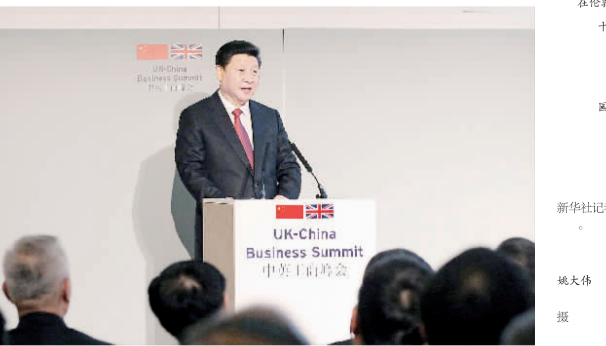
本报伦敦10月21日电 记者王宝锐 蒋华栋报道:当地时间21日下午,国家主席习近平和英国首相卡梅伦共同出席在伦敦金融城举行的中英工商峰会并致辞。习近平指出,当前世界经济气候风云变幻。越是在

前景不确定的时候,我们越是需要坚定信心。历史经验和经济规律告诉我们,世界经济发展从来不是一帆风顺,但增长终究是趋势,一时的数据高低或市场起伏不能改变这个大势。(下转第二版)