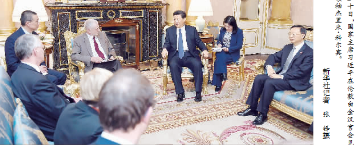
本报伦敦10月20日电 记者王宝锐 蒋华栋报道:当地时间20日,国家主席习近平在下榻的白金汉宫会见英国工党领袖科尔宾。习近平指出,中英建交40多年来,两国关系日臻成熟稳定。新形势下,中英加强友好合作,不仅造福两国人民,也有利于世界和平、稳定、繁荣。经贸合作是中英关系的“推进器”和“压舱石”,面临广阔前景。(下转第二版)