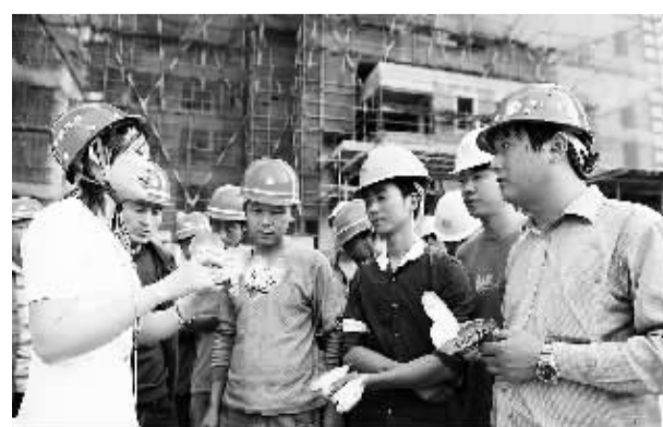
安徽省合肥市方兴社区近日将流入辖区的流动人口纳入本地区经常性管理服务范围...