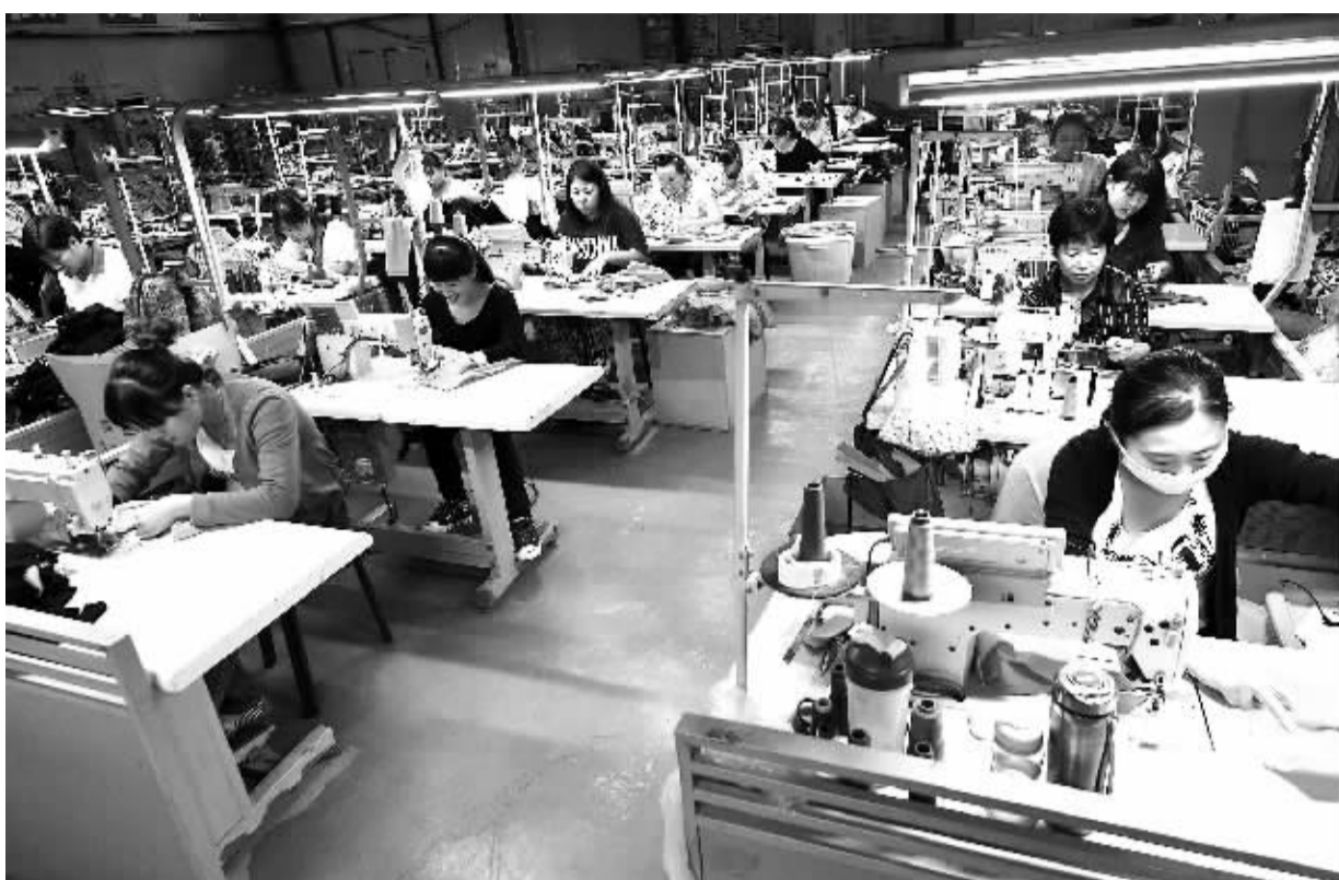
近年来，河北永清县通过加大农民培训力度，引进劳动密集型企业，为农民搭建就业平台...