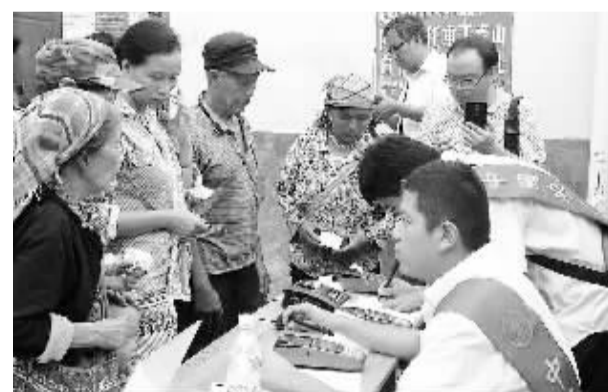
近年来，云南省积极推进加载金融功能社会保障卡(金融社保卡)的发行...