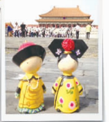
故宫博物院的文化创意产品。