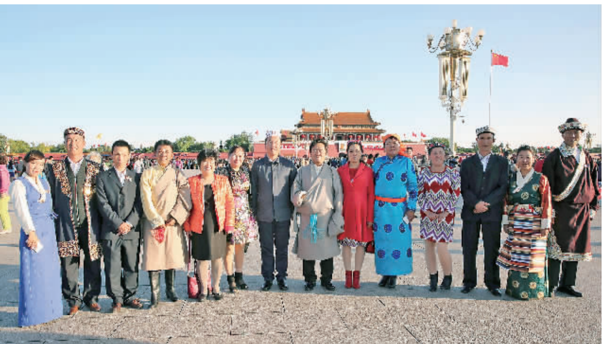
左图 10月1日,来自内蒙古、广西、西藏、宁夏、新疆5个自治区的基层民族团结优秀代表来到天安门广场,庆祝中华人民共和国成立66周年。

“五星红旗,你是我的骄傲;五星红旗,我为你自豪;为你欢呼,我为你祝福……”又是金秋10月,又是一年硕果累累。五星红旗每一次升起都承载着激动、喜悦与自豪。在庆祝新中国66华诞之际,广大干部群众纷纷以各种方式表达自己对祖国的深情,对国旗的热爱——