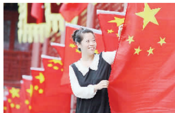
10月1日,山东滕州市北辛街道接官巷商贸城,一名经营户在挂国旗。