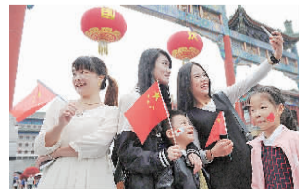
10月1日,北京市前门步行街,游客们手持国旗欢度国庆。