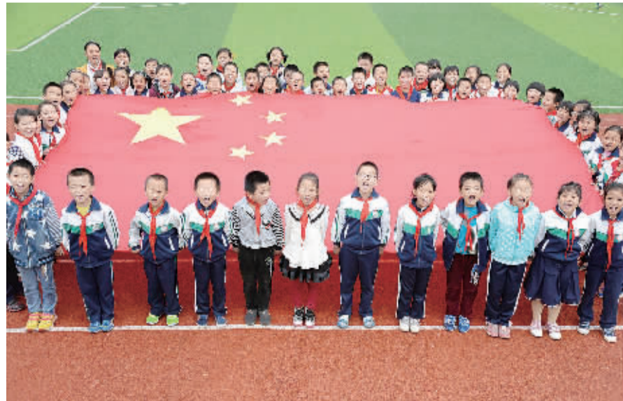
右图 9月29日,河北省望都县新城区小学的学生与国旗合影。