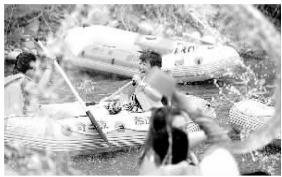
游客在景区进行漂流体验。