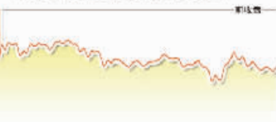
9月29日上证综指走势图