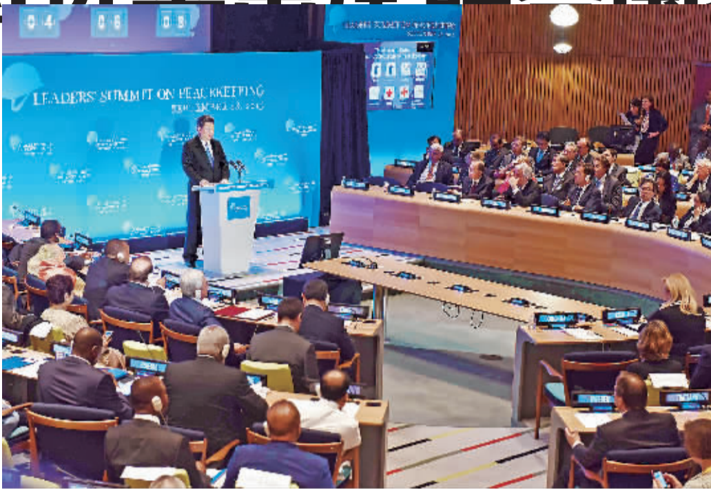
9月28日,国家主席习近平在纽约联合国总部出席联合国维和峰会并发表讲话。