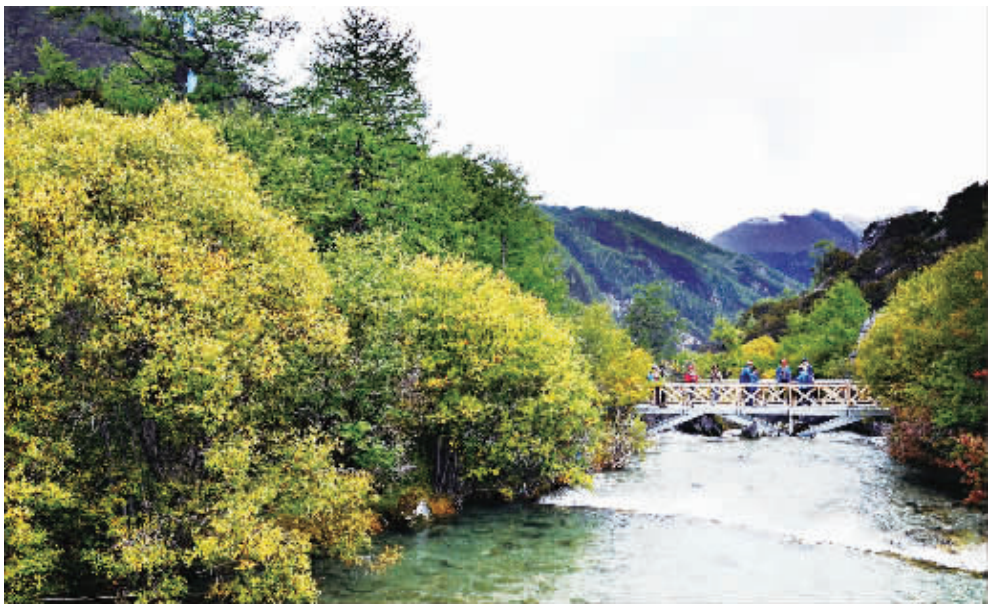
四川稻城亚丁冲古草甸秋色宜人,你在桥上拍风景,拍风景的人在另一座桥上拍你。