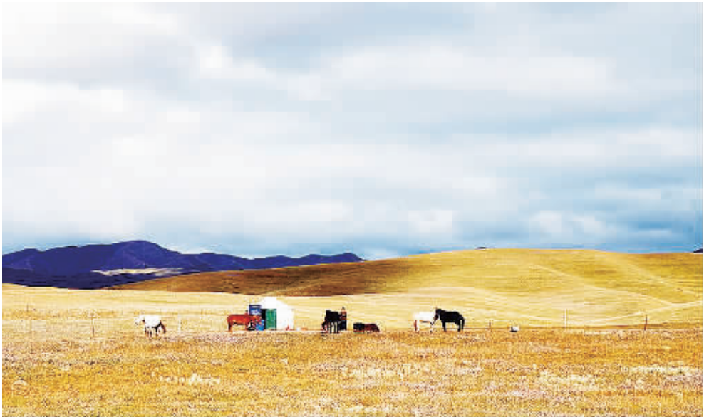
金秋时节,甘肃省甘南藏族自治州夏河县境内辽阔的桑科草原如画般美丽。