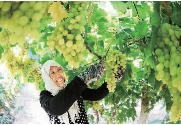
▲新疆兵团第十三师红星二场职工在采摘无核白葡萄。金秋时节,这里种植的3000多亩葡萄进入采摘季。