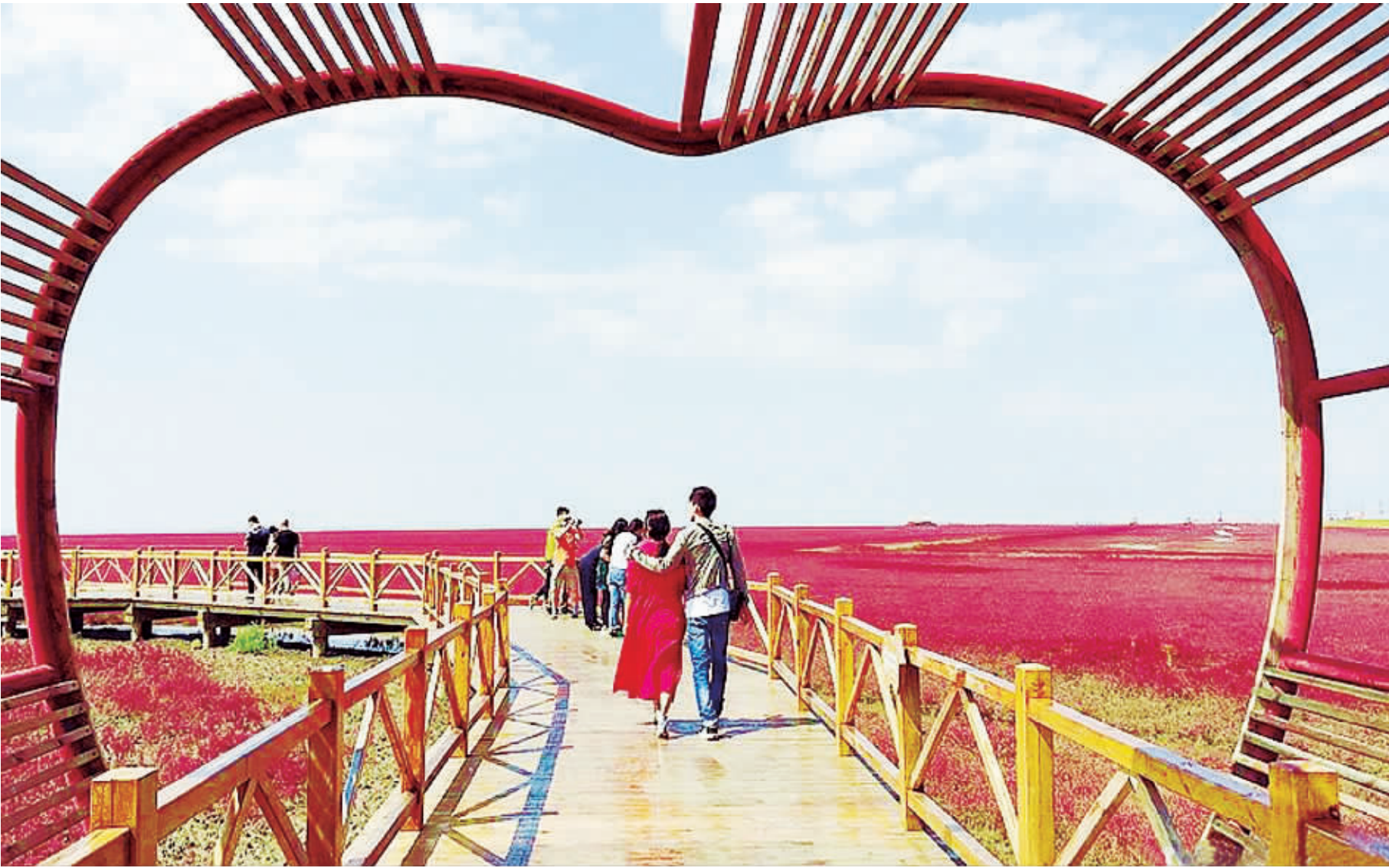
▲辽宁盘锦碱蓬红草进入秋后生长旺盛时期,逐渐红遍海滩,吸引了众多游客,景区开辟的爱情廊让年轻游客感受到温馨甜蜜。 ►秋风把江西遂川县营盘圩乡的山村打扮得绚丽多彩。

金秋时节,总是忍不住走出家门,去拥抱自然。这是收获的季节,也是欢乐的季节。随处可见的美景,让人流连忘返。那就拿起相机和手机,一起来拍吧!让我们用镜头定格下风景的美丽,记录下生活的美好。中国经济网自9月15日起推出“金秋美景随手拍”活动,并为本次活动制作特别专题;经济日报法人微博于9月18日在新浪微博发起“金秋美景随手拍”有奖投稿活动。“金秋美景随手拍”要求网友图片或视频需要彰显绿色、生态、人文、和谐理念,具有较强视觉吸引力,能够让网友感受到绚丽金秋的律动,且照片或视频为原创,可以是旅途中拍到的美丽秋景、各地丰收景象、身边的风景等。至今已收到网友照片近百幅,刊出55幅。现选登部分网友作品,让我们共享秋天之美!