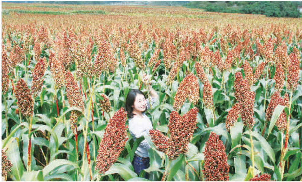
云南曲靖罗平2万余亩红高粱喜获丰收。火红的高粱成了一道亮丽的风景线。