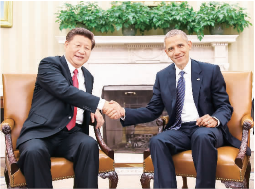
9月25日,国家主席习近平在华盛顿同美国总统奥巴马举行会谈。