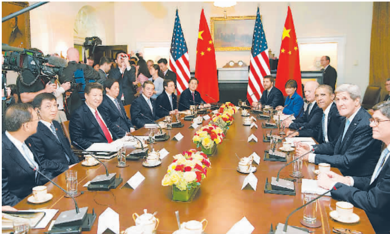
9月25日,国家主席习近平在华盛顿同美国总统奥巴马举行会谈。