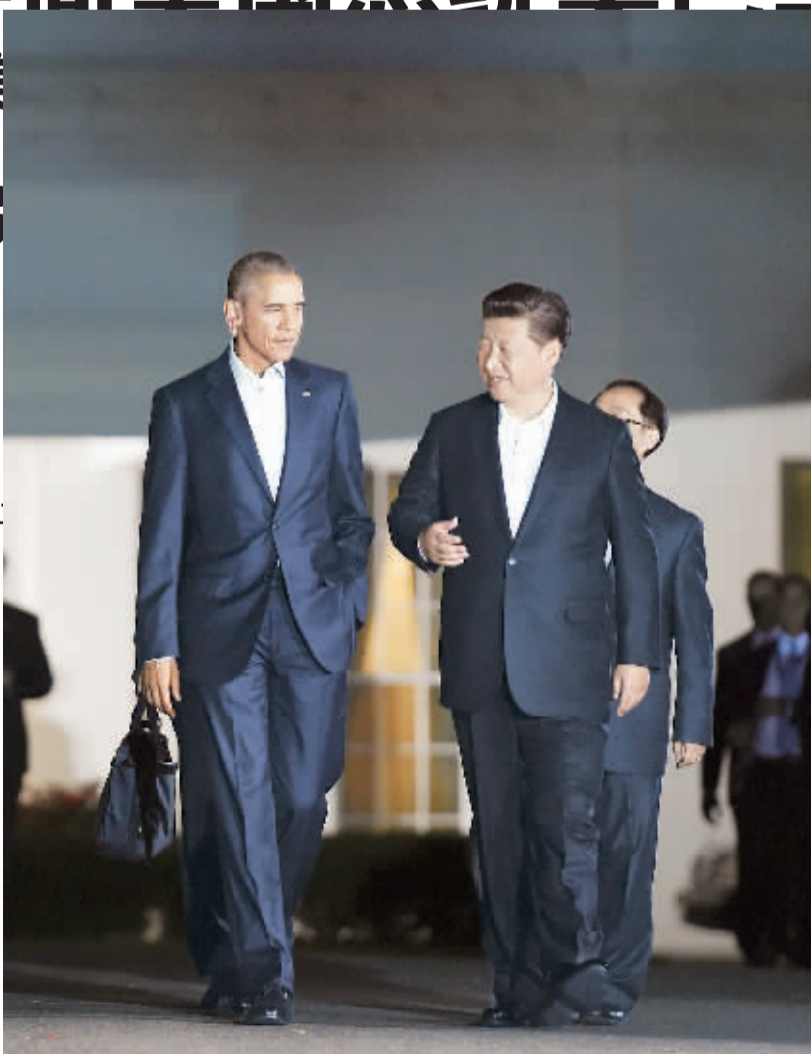
9月24日晚,国家主席习近平在华盛顿布莱尔国宾馆同美国总统奥巴马举行中美元首会晤。这是两国元首在前往布莱尔国宾馆的路上边走边谈。