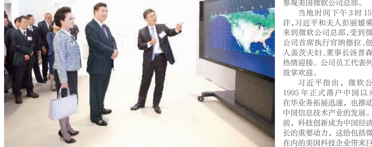
9月23日,国家主席习近平在西雅图附近的雷德蒙德市参观美国微软公司总部。这是习近平夫妇观摩大数据可视化系统展示。