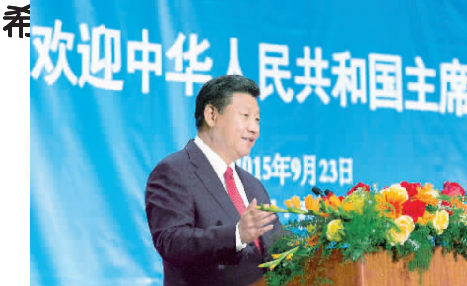
9月23日,国家主席习近平和夫人彭丽媛在西雅图出席美国侨界欢迎招待会。习近平发表讲话。

新华社美国西雅图9月23日电 (记者霍小光 齐紫剑) 国家主席习近平和夫人彭丽媛23日在西雅图出席美国侨界欢迎招待会。习近平发表讲话强调,实现中华民族伟大复兴是海内外中华儿女的共同梦想。今天,我们比历史上任何时期都更加接近实现中华民族伟大复兴的目标。相信广大旅美侨胞一定能够在这一伟大进程中作出独特贡献。 习近平在讲话中代表祖国和人民向在美国工作和生活的全体同胞致以问候和祝愿。习近平指出,广大旅美侨胞顽强拼搏、艰苦创业,为美国发展繁荣作出了贡献,赢得了美国人民尊重。150年前,数以万计的华工漂洋过海来到美国,参与建设美国太平洋铁路,铺就了通往美国西部的战略大通道,成为旅美侨胞奋斗、进取、奉献精神的丰碑。旅美侨胞关心祖国前途命运,积极支援祖国抗击日本军国主义侵略的斗争,踊跃支持祖国建设,推动两岸关系和平发展,为祖国发展、统一和民族复兴作出重要贡献。旅美侨胞是中美关系的参与者、建设者、推动者,在中美两国和两国人民间架起友谊和合作的桥梁。中美关系30多年发展所取得的成绩,同广大旅美侨胞不懈努力密不可分。 习近平强调,中美关系是当今世界最