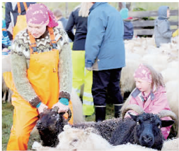
9月中旬开始，一年一度的圈羊节活动在冰岛展开，各农场以家庭为单位，骑马、骑摩托或者步行，把在旷野中散养了一个夏天的羊只圈起来，再通过辨认羊耳朵上的编号，把各家的羊赶到各农场的圈里。整个活动将持续两周时间。图为在冰岛马尔夫斯瓦地区，一名农场女主人和女儿在认领自家的羊。

据该组织统计，东南亚地区每年新增癌症人口高达170万，因癌症死亡人口为110万。世界卫生组织东南亚分支负责人普纳姆·凯特帕尔·辛尔表示，鉴于该地区癌症病患的特点，防癌计划的综合性有待增强，特别是在发现和预防病变风险、早期发现和治疗、低价治疗方案和药物等领域要争取突破。此外，该组织在会上通过决议，号召东南亚各国重视烟酒、不健康饮食、生理缺陷、风险行为、有害环境等致癌因素，有效增强民众防癌意识。