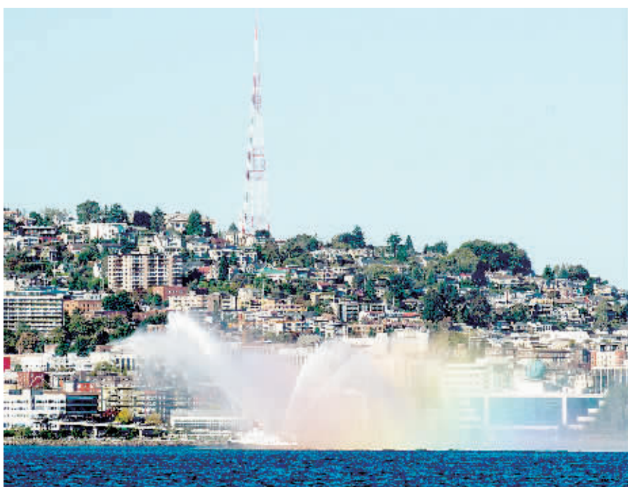
中国国家主席习近平当地时间22日开始访美，首站为华盛顿州西雅图。华盛顿州拥有波音、微软、星巴克等知名公司，与中国都有着密切生意往来。中国是这些公司最大的市场之一。图为在美国西雅图市区。

近年来，中国企业把美国作为国际化战略中的重要目标国，中美日益紧密的双边贸易与投资关系，正为美国经济增长提供源源不断的动力。双汇收购全球最大猪肉加工企业史密斯菲尔德，安邦收购华尔道夫酒店，这些企业间的并购为美国企业提供了新的发展前景。中车在华盛顿州投资建设制造基地，为当地新增150个工