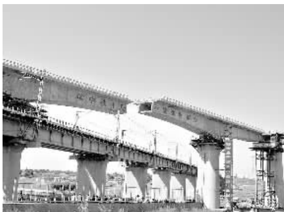
9月23日，内蒙古首条高速铁路呼和浩特至张家口客运专线兴和特大桥转体后，成功跨越张集铁路前河大桥。