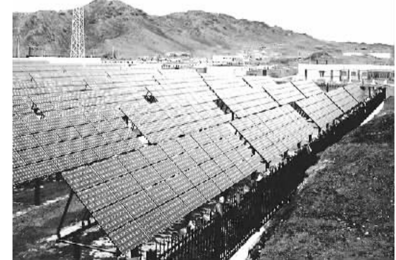
特变电工新疆新能源股份公司制造并安装的太阳能电站。

主体责任和纪委监督责任,各级党委作为党风廉政建设的责任主体,既要部署工作的领导者,加强领导,精心组织,又要当好全面落实的执行人、推动者,切实贯彻落实中央关于党风廉政建设的部署,充分发挥出示范引领作用。同时,紧紧依靠人民,织密群众监督之网,开启全天候探照灯,把各级组织和党员干部的表现都交给群众评判,建立群众监督和从严治党良性互动。 多管齐下、破立并举,全面从严治党取得了重大成效,令党风政风为之一新,党心民心为之一振,极大地提高了中国共产党在全国各族人民中的崇高威望。百姓感受最深的是:党员领导干部下基层调研的多了,为人民群众考虑的多了,与不法商人之间称兄道弟的少了,形式主义、官僚主义、享乐主义和奢靡之风少了……“严以修身,严以用权,严以律己,谋事要实、创业要实、做人要实”的“三严三实”,正在成为越来越多党员干部的修身之本、为政之道、成事之要。 “雄关漫道真如铁,而今迈步从头越”。办好中国的事情关键在党,全面深化改革关键在党,党的建设永远在路上。面对严峻复杂的形势,继续以改革创新精神全面从严治党的,以强烈的历史责任感,抓铁有痕、踏石留印的劲头持续推进党的建设伟大工程,拥有8700余万党员的中国共产党,必能带领全国各族人民在复兴圆梦的征途上披荆斩棘、乘风破浪、昂扬奋进。