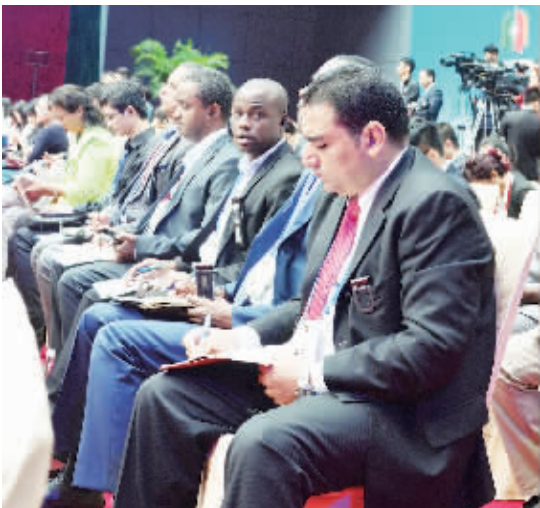
图为各国与会嘉宾在认真聆听和记录会议精神。