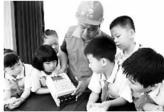
近日,江西南丰县中小学同学们在新学期开学伊始,学习使用智能电表。图为国家电网南丰公司职工为同学们讲解安全用电知识。