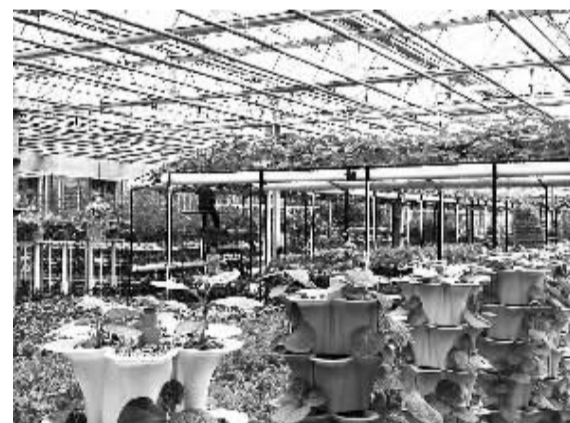
在东北地区，发展现代农业具有得天独厚的优势。

结构调整等不来、熬不起，唯一路径就是主动调、科学转。当前，东北振兴取得了阶段性成果，东北发展仍具有较大的发展潜力，东北地区需要利用好当前宝贵的“窗口期”，加快结构调整和转型升级，为下一轮东北振兴赢得主动。