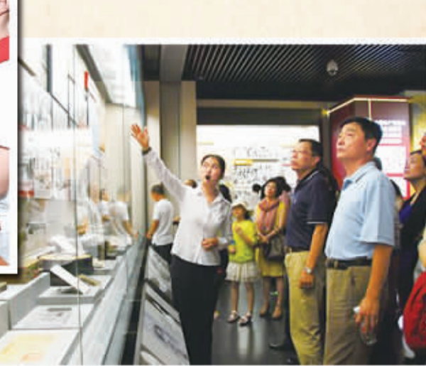
在央企企业职工在中国人民抗日战争纪念馆参观“伟大胜利历史展览”。——中国人民抗日战争暨世界反法西斯战争胜利70周年主题展览。