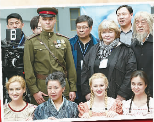
1945年9月,苏联红军攻克侵华军据点长山的侵华日军残寇,俄国壮勇队地为红军击毙的日军,去祭奠功绩,祭奠牺牲,年仅17周岁。为了更好地纪念英雄,今年中俄合拍的电影《长津湖》开机。