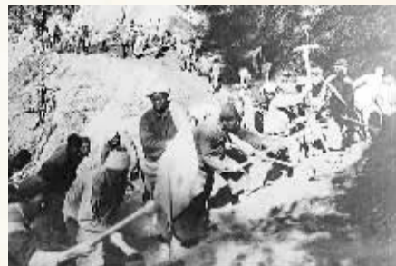
1938年，各族群众修筑滇缅公路永平段，打通国际运输大通道。