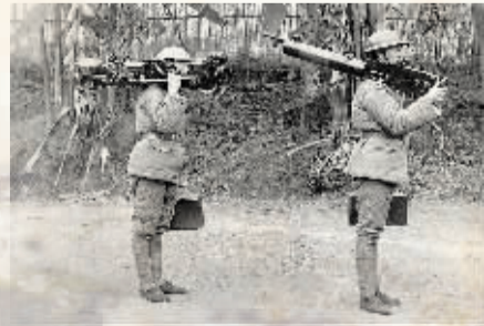
从1937年到1940年，数百家民族工业企业迁往大后方继续生产，图为中国工人肩扛着内迁兵工厂生产的重机枪。