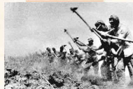
上世纪40年代初，抗日根据地开展大生产运动，八路军359旅在南泥湾开荒。