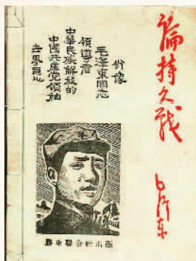
△ 抗日根据地出版的《论持久战》。▷ 1938年，毛泽东同志在撰写《论持久战》。

《论持久战》的发表，使毛泽东同志赢得了全党同志发自内心的赞许、佩服，从而最终确立了在党内无可替代的领袖地位和崇高威望。 ——吴玉章（老一辈革命家）