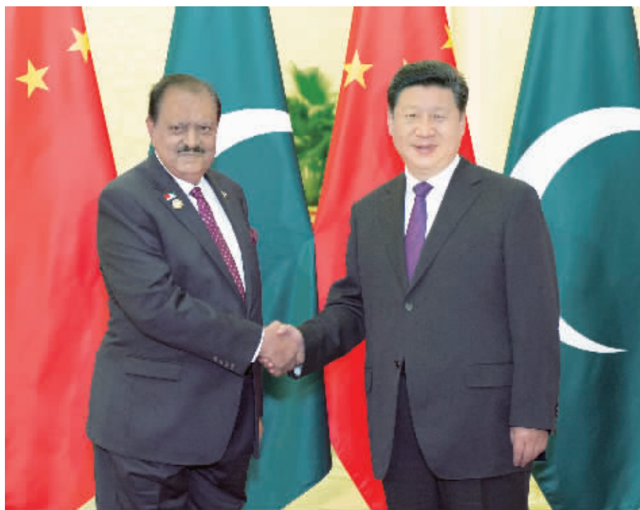
9月2日,国家主席习近平在北京人民大会堂会见巴基斯坦总统侯赛因。