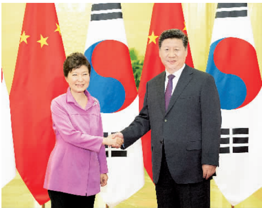
9月2日,国家主席习近平在北京人民大会堂会见韩国总统朴槿惠。

习近平强调,中方始终坚持朝鲜半岛无核化目标,坚持维护朝鲜半岛和平稳定,坚持通过对话协商解决有关问题。中方主张六方会谈“9·19”共同声明和联合国安理会有关决议得到切实履行,反对任何导致局势紧张的行动。各方要坚持半岛无核化目标,为早日重启六方会谈并取得积极进展作出努力。中方欢迎南北双方继续通过对话改善关系,推进和解合作,最