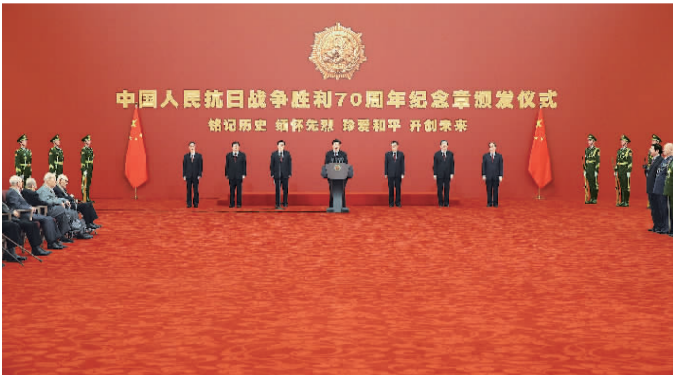
9月2日,中共中央总书记、国家主席、中央军委主席习近平在北京人民大会堂向30名抗战老战士老同志、抗战将领、帮助和支持中国抗战的国际友人或其遗属代表颁发中国人民抗日战争胜利70周年纪念章并发表重要讲话。