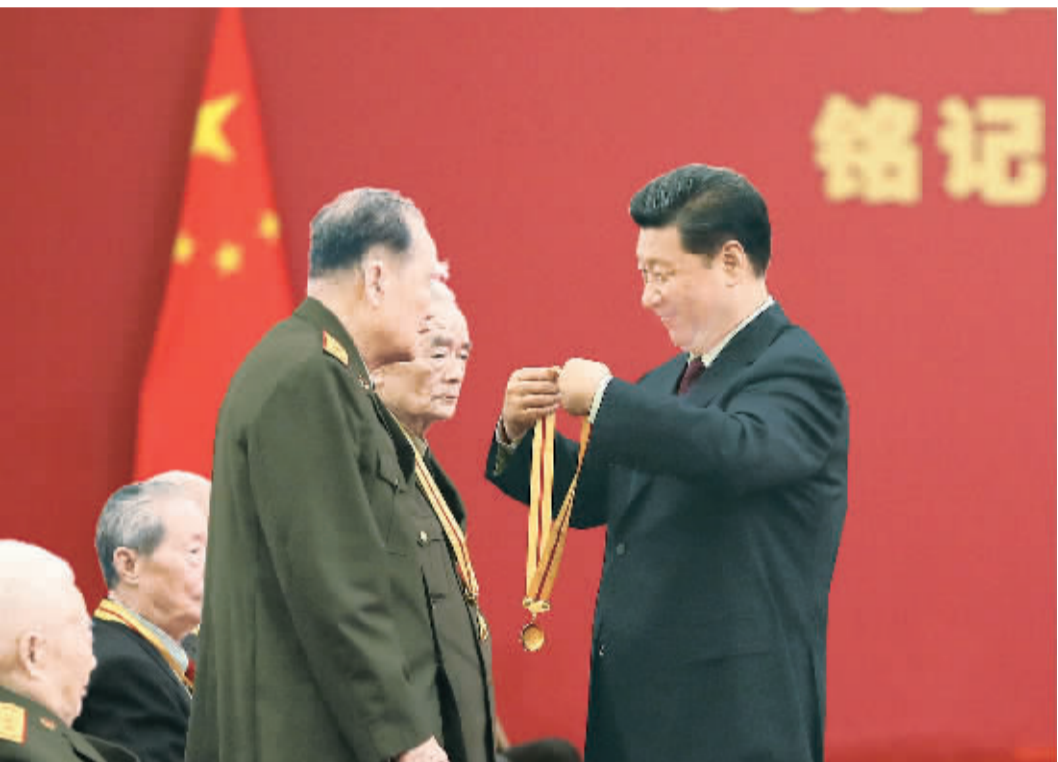
9月2日,中共中央总书记、国家主席、中央军委主席习近平在北京人民大会堂向30名抗战老战士老同志、抗战将领、帮助和支持中国抗战的国际友人或其遗属代表颁发中国人民抗日战争胜利70周年纪念章并发表重要讲话。