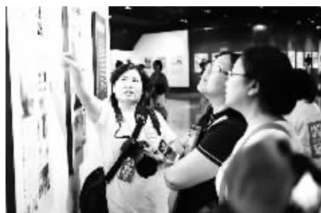
8月29日，纪念抗战胜利70周年全国媒体优秀版面暨摄影作品展在北京中华世纪坛举办，吸引了许多市民前来参观。