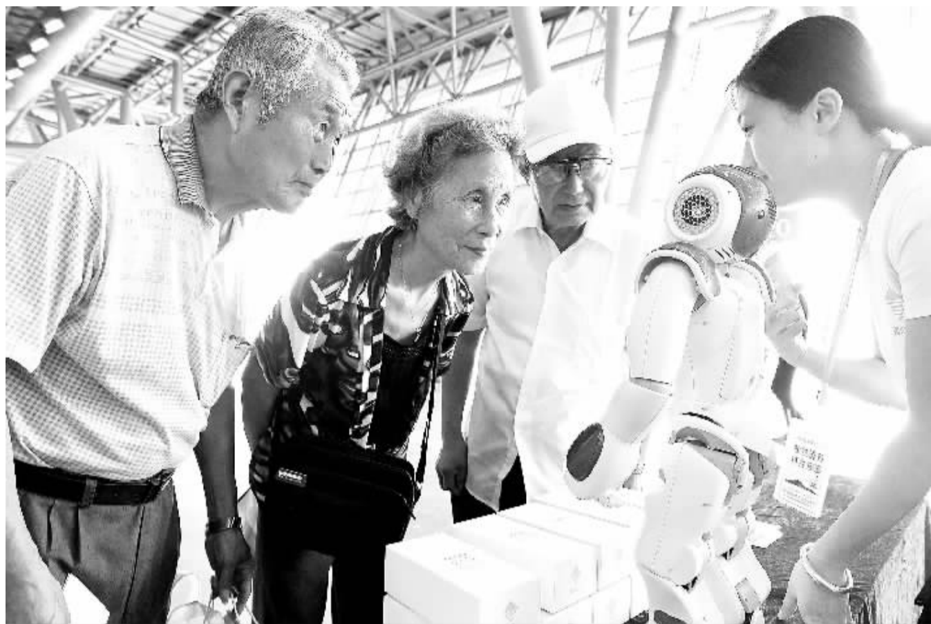
近日，工作人员在安徽省养老服务业博览会上给市民演示居家互联网智能养老服务设备。智能化养老涵盖家政服务、紧急求助、医疗保健、精神慰藉等多项内容，产业发展前景广阔。

养老基金入市对中国实体经济和资本市场的健康发展都将有积极作用。养老基金进入市场的目的不是为了托市或救市。国家将在制度层面上，对委托、受托、投资、经办、监督各个环节明确相应规定，在确保安全的前提下实现养老基金保值增值——