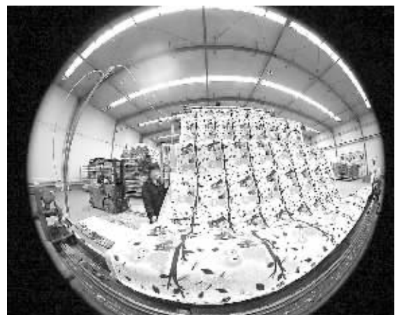
山东阳信县诺瑞织品有限公司瞄准市场需求，开发了部分使用玉米纤维的地毯产品，销往国内外市场。图为8月18日该公司员工在展示产品。