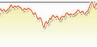
8月19日上证综指走势图