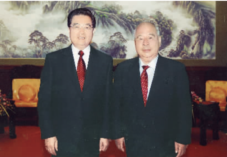
2009年10月1日，首都各界庆祝中华人民共和国成立60周年联欢晚会在北京举行。这是出席活动的胡锦涛同志与尉健行同志合影。