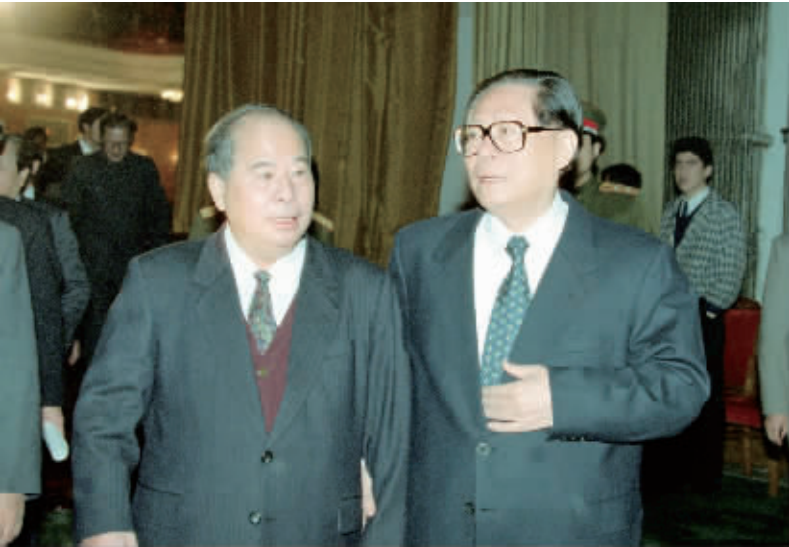
1996年11月12日，全国政协在人民大会堂隆重举行孙中山先生诞辰130周年纪念大会。这是出席活动的江泽民同志和尉健行同志在一起交谈。