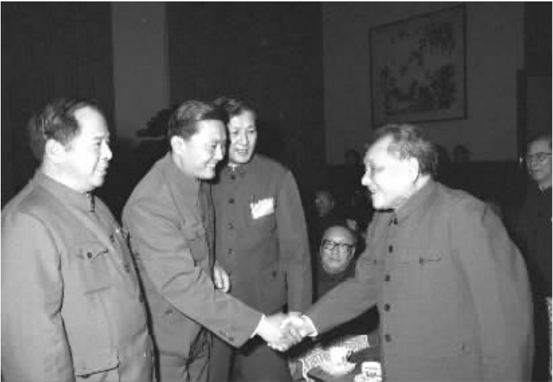
1983年10月29日，邓小平同志和新当选的全国总工会领导人见面。左一为尉健行同志。