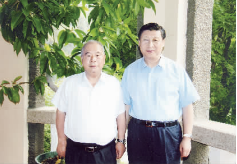
2010年7月31日，习近平同志在北戴河看望尉健行同志时合影。