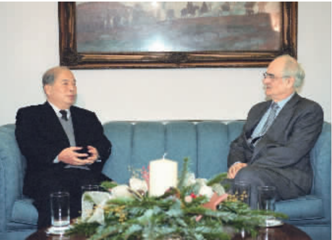
尉健行同志在雅典会见希腊议会议长阿波利托斯·卡拉马尼斯。