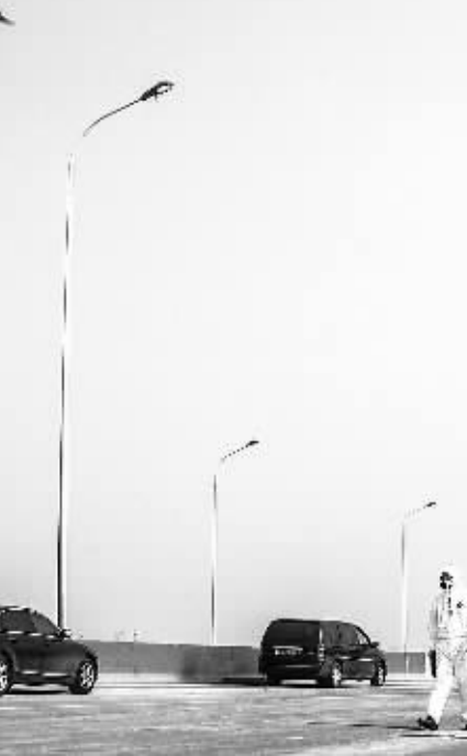
8月16日,工作人员利用无人机在天津港“8·12”瑞海公司危险品仓库特别重大火灾爆炸事故现场附近进行测绘,观察地形及变化。