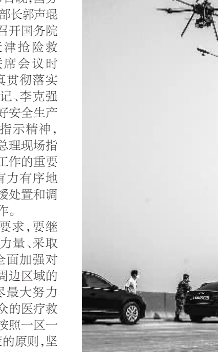
8月16日,工作人员利用无人机在天津港“8·12”瑞海公司危险品仓库特别重大火灾爆炸事故现场附近进行测绘,观察地形及变化。

今年上半年,广州制订了《2015-2017年广州国际航运中心建设三年行动计划》,明确提出,要建设国际航运中心目标,从单纯的码头“搬运工”,向建设具有较强辐射能力和资源配置功能的国际航运中心这一更高目标进发。