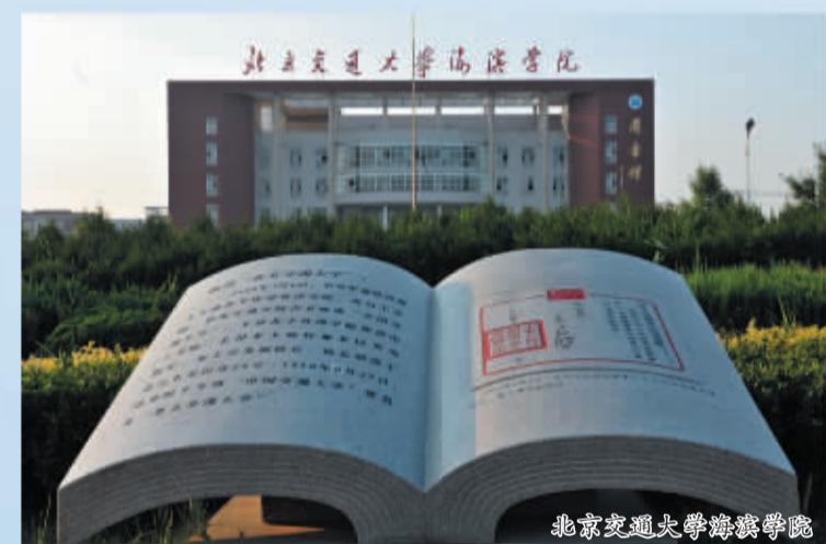
北京交通大学海滨学院