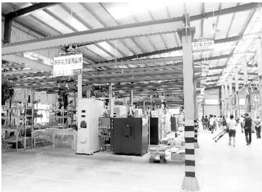
图为东莞(韶关)产业转移工业园甘棠片区。