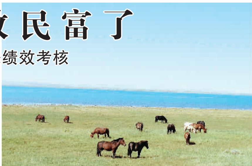
青海海西州柴达木盆地尕斯库勒湖畔的草原。

2014年, 青海省委、省政府将刚察县作为绩效管理试点县, 试点方案中要求, 建立草原生态保护补奖资金与禁牧减畜、草畜平衡管理挂钩, 健全草原生态监测体系和核查监管机制, 完善扶持后续产业发展的配套政策措施, 探索建立规范的绩效考核评价指标体系, 保护草原生态环境, 促进草原生态畜牧业可持续发展, 确保实现禁牧不禁养、减畜不减肉、牧民收入不下降的目标。同时将禁牧减畜纳入村规民约, 充分发挥牧民群众监督作用, 建立起民间互相监督、互相