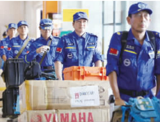
中国驻缅甸使馆日前召集在缅中资企业举行缅甸洪灾人道主义救助协调会,号召中资企业积极参与救援行动。与此同时,作为缅甸水灾以来第一支抵缅的国际救援力量,中国蓝天救援队第一批10名队员5日紧急奔赴实皆省重灾区。图为中国蓝天救援队队员抵达缅甸仰光国际机场。

本报讯 记者陈颀、实习生白玉竹报道:第十届北京国际商务及会奖旅游展览会(CIBTM)日前在北京举行。来自新西兰旅游局、泰国会议展览局和斯里兰卡会议局等400家国内外供应商参展。 据CIBTM高级项目经理陈兮介绍,该展会是专门针对中国及亚洲市场的商业平台。CIBTM作为首个推出“旅保结合”概念的会奖旅游展会,旨在深化旅游与保险的“跨界合作”,保障中国保险用户出境的保险及救援需求。