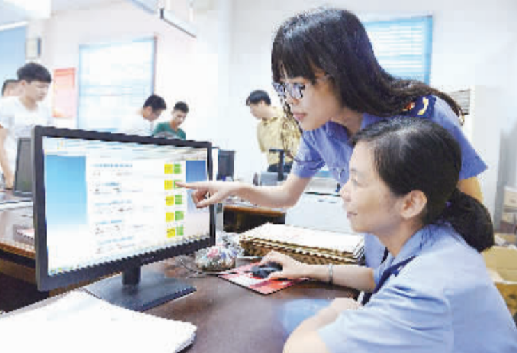
7月28日,南昌市西湖区工商局工作人员登录南昌市企业监管警示系统,认真查看企业信息情况。

分化加剧亮点增多 二季度,工业经济结构调整继续向纵深推进,行业走势分化加剧,一些行业和地区承受着较大的调整阵痛,转型升级较快的行业和地区则呈现良好发展势头。 当前,产能过剩矛盾突出,并且集中体现在资源型及资源密集型行业运行上,钢铁、煤炭、建材等行业走势疲弱,工业传统的动力不断衰减。 二季度企业景气调查结果显示,企业的设备利用率同比仍呈下滑态势。较大的产能过剩导致库存积压加剧,二季度工业库存和产成品资金进一步较大幅度下滑,工业生产者价格连续40个月同比下跌,对工业增长形成了很大的压力。钢铁、煤炭、水泥、建材等资源型及资源密集型行业价格下跌,库存上升、效益滑坡状况愈发严重,与这些产业关联度大的东北、西北等一些地区经济也遭遇困难。 与之形成鲜明对照的是,高技术行业快速增长,两高产品市场需求旺盛,转型升级快的企业发展欣欣向荣,工业创新发展的动能不断增强。(下转第三版)