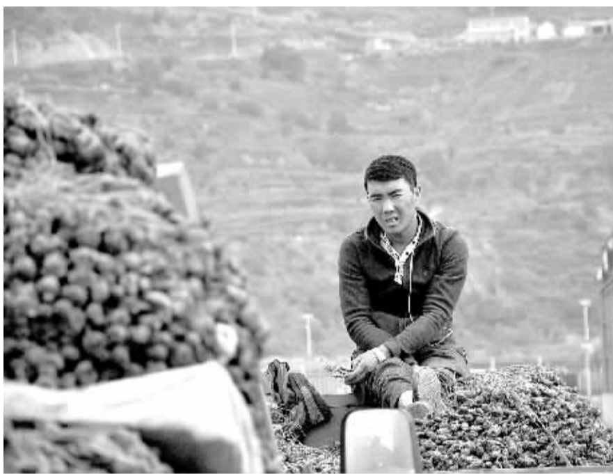
在甘肃岷县当归城，一位种植户坐在满载当归的车上。

为应对市场疲软，岷县以中医药产业转型升级为抓手，推进品牌战略，制定产业标准，提升产品附加值，提高“岷归”含金量。