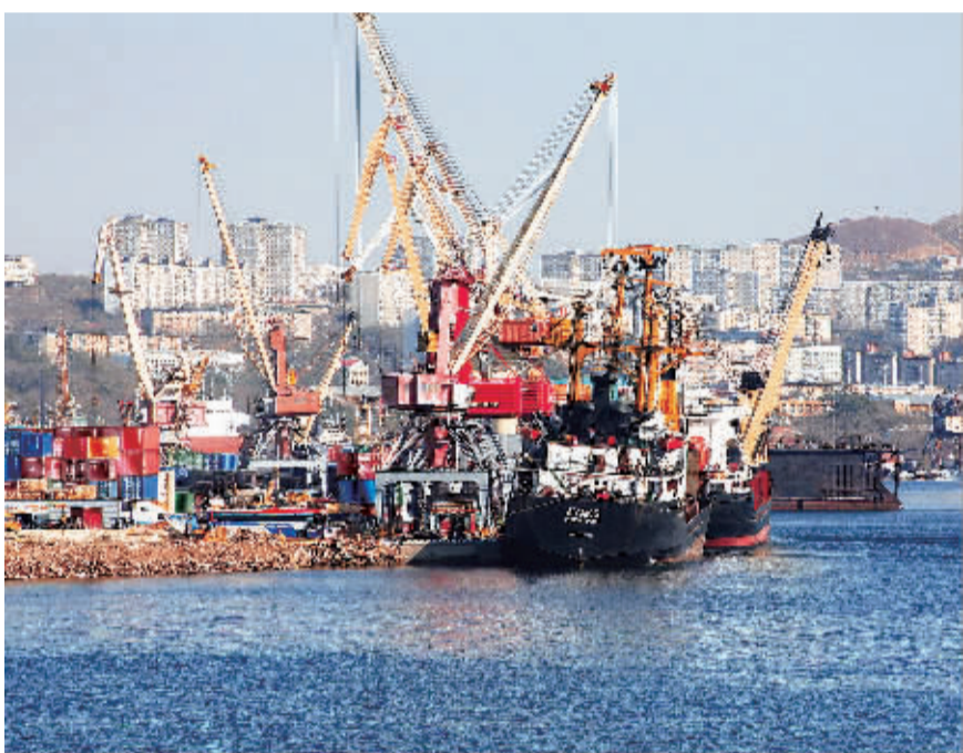
今年上半年,俄远东地区港口货物吞吐量同比增长2.7%,达8300万吨,其中符拉迪沃斯托克港货物吞吐量为610万吨。图为港口繁忙景象。

在东北亚地区,中国、韩国和日本的港口密布,符拉迪沃斯托克自由港的优势在哪里?俄业内人士认为,一方面,符拉迪沃斯托克港口凭借其地理条件和深水湾特点,可以为大吃水深度货轮提供