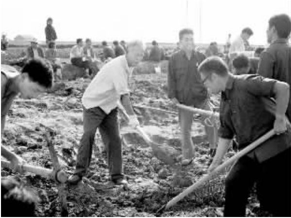
1978年秋，万里同志（前左二）在安徽省合肥市郊农村了解情况，并参加劳动。