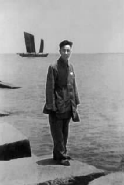
上图 1949年南京解放时的万里同志。

规划建设事业的奠基人之一。 1958年3月起，万里同志先后任中共北京市委书记处书记、北京市副市长。在北京市工作期间，他曾协助周恩来总理负责国庆10周年献礼工程建设，呕心沥血，迎难而上，带领广大干部职工，坚持“古为今用，洋为中用”，精心设计，精心施工，仅用不到一年时间，就圆满完成人民大会堂等北京“十大建筑工程”建设任务。“十大建筑工程”的设计标准、建筑艺术、施工质量和速度都达到当时世界先进水平，创造了世界建筑史上的奇迹，受到了毛泽东主席充分赞扬，称赞他为“别人日行千里，而你是日行万里”。 1971年3月，万里同志任中共北京市委常委、市革委会工交城建组副组长。“文化大革命”中，万里同志受到严重迫害，被监护审查。他坚持原则，对林彪、江青两个反革命集团的倒行逆施深恶痛绝，以实际行动进行了积极抵制和斗争，表现了共产党员的坚定信念。1973年5月，万里同志解除劳动改造，恢复工作，任中共北京市委书记（当时设有第一书记），北京市革委会委员、副主任。他提出一定要把首都规划好、建设好、管理好，并敏锐地提出了保护环境、治理污染的主张和措施。 1975年1月，万里同志任铁道部部长，后任铁道部党的临时领导小组组长。他坚决支持邓小平同志提出的实行全面整顿、把铁路系统作为整顿突破口的主张，认真贯彻落实整顿的方针，深入调查研究，针对铁路系统存在的问题，提出实现“四通八达，畅通无阻，安全正点，当好先行”的目标，坚决反对和制止派性，坚持整顿领导班子、健全规章制度、狠抓铁路运输秩序，迅速扭转了铁路系统的混乱局面，使陷于瘫痪状态的铁路系统焕发了生机。（下转第七版）