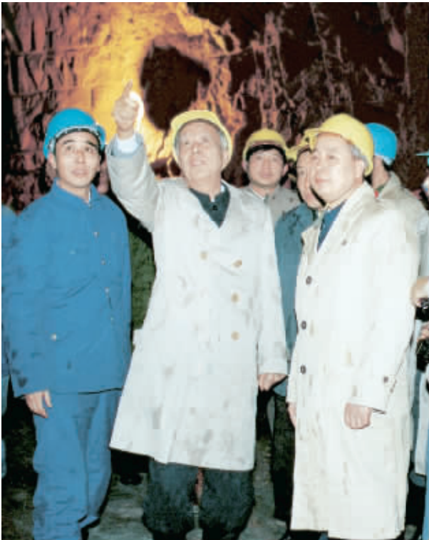
右图 1985年12月，万里同志考察衡广铁路复线工程，在大瑶山隧道掌子面视察。