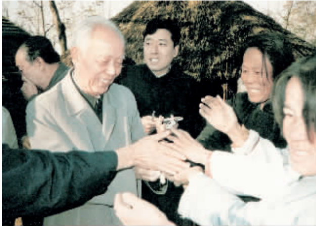
1985年11月，万里同志在山东沂蒙山革命老区时，群众拿出自产的花生招待他。