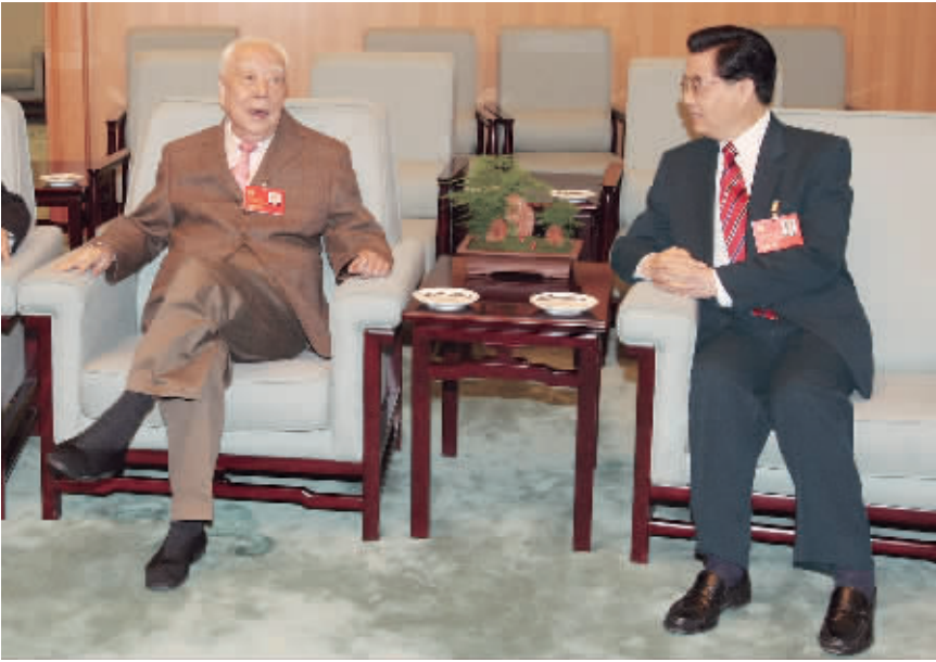
2007年10月15日，党的十七大开幕前，胡锦涛同志和万里同志亲切交谈。