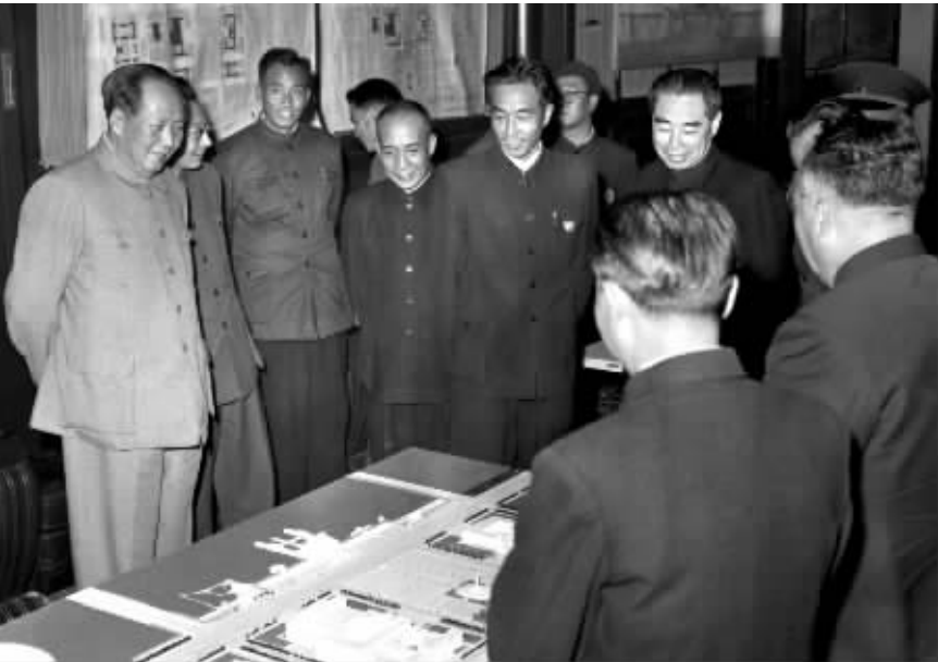
1958年10月，毛泽东等中央领导同志审查天安门广场设计方案。左六为万里同志。