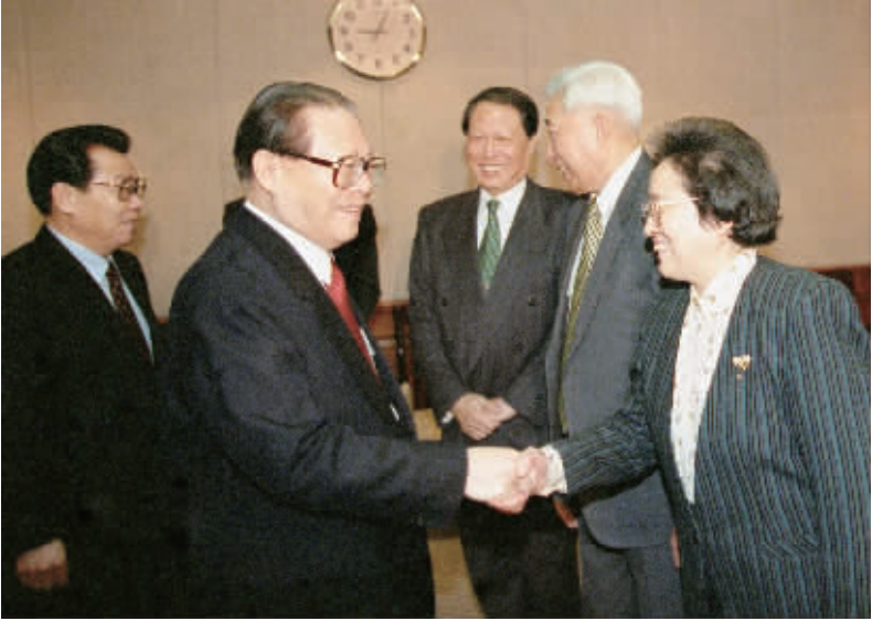
1997年1月1日,江泽民同志在北京亲切会见民革、民盟、民建中央新任主席何鲁丽、丁石孙、成思危(右三)。