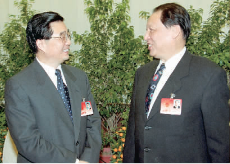
2002年3月8日,胡锦涛同志在北京人民大会堂与成思危同志亲切交谈。