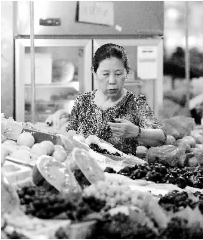
7月9日，市民在河北省石家庄市塔北路农贸市场购买水果。

7月9日，金陵海关驻新生圩办事处关员正核对报关单。当日，价值近万元的日本直购商品在南京龙潭跨境电子商务产业园内顺利试运行通关。这也是江苏电子商务直购进口的第一单。