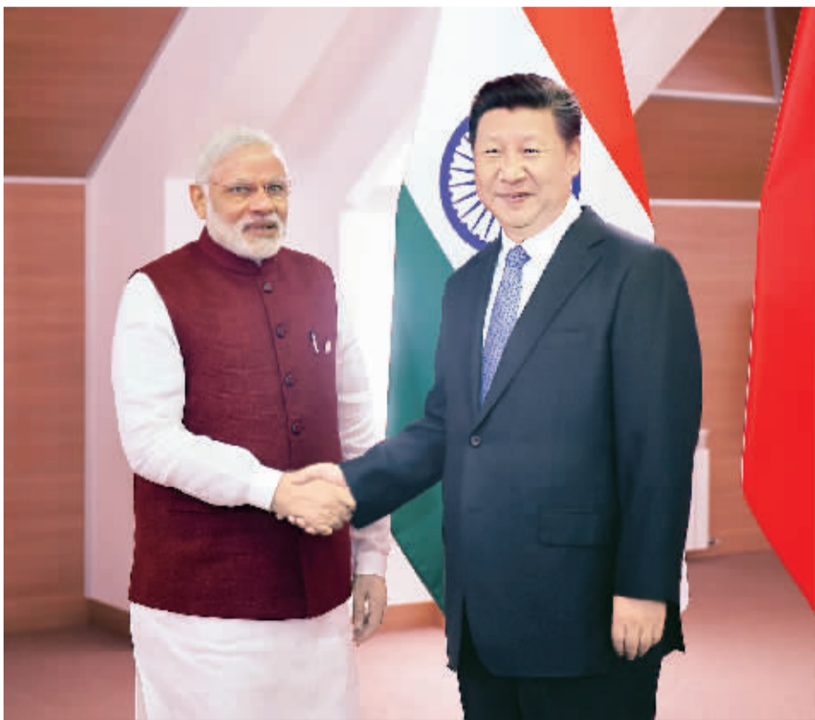
7月8日,国家主席习近平在俄罗斯乌法会见印度总理莫迪。

习近平指出,中印同为金砖国家坚定支持者和积极建设者,要共同致力于建设金砖国家更紧密、更全面、更牢固的伙伴关系,努力推动金砖国家发挥积极建设性作用,为世界和平、发展作出更大贡献。