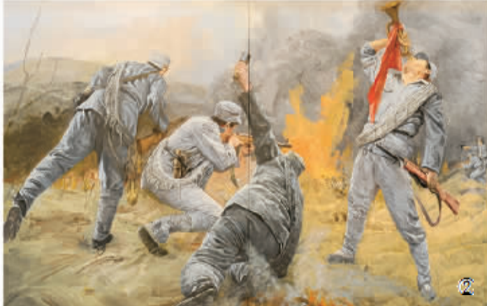
①书法 李景平 ②《吕梁英雄》 油画 吕宇潮 ③《薛公领围歼战》 油画 杨岩 ④《抗日灯火》 版画 王玉珍 ⑤《军火合作社》 剪纸 武毅星 刘全爱