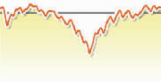
6月23日上证综指走势图