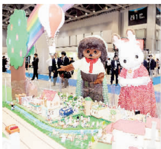
“2015东京玩具节”18日在日本东京开幕,约147家玩具商展示了近35000件玩具。造型新颖、功能实用的玩具吸引了众多玩具爱好者和商家。图为日本东京国际展示场拍摄的玩具节现场。

据悉,布基纳法索从2003年起开始从美国孟山都公司引进转基因棉花技术并在国内大范围种植。2007年,该国棉花种植超越埃及成为非洲第一大产棉国,也因此成为非洲唯一大规模种植转基因棉花的国家。棉花种植已超过黄金成为该国创汇第一支柱产业,有超过350万人直接以此为生。去年,该国棉花总产量达到创纪录的71万吨,今年的目标是80万吨。