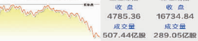
6月18日上证综指走势图