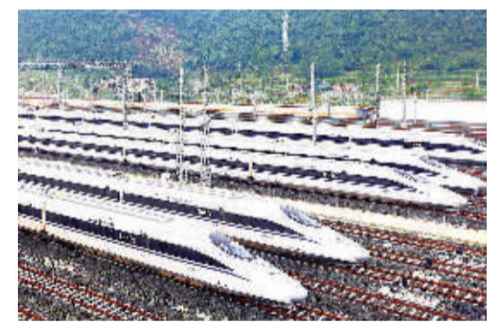
这是6月18日在贵阳北站动车所拍摄的承运沪昆高铁的动车组列车。

本报讯 记者齐慧 吴秉泽报道:18日11时50分,贵阳北开往长沙南的G3002次动车组准时发车,标志着沪昆高铁贵州东段正式开通,贵州全面融入高铁网。 沪昆高铁新昆西至贵阳北段全长286公里,全线设铜仁南、三穗、凯里南、贵定北、贵阳东、贵阳北6个车站,初期运营时速300公里。 沪昆高铁新昆西至贵阳北段是国家《中长期铁路网规划》“四纵四横”客运专线主骨架中沪昆高铁的重要组成部分。目前,沪昆高铁贵阳北至昆明南段正在紧张施工中,预计明年全线贯通。届时,沪昆高铁将直接连通长江经济带的上海、浙江、江西、湖南、贵州、云南6个省市,并通过高铁、支线快铁通达长江经济带沿线所有地区。