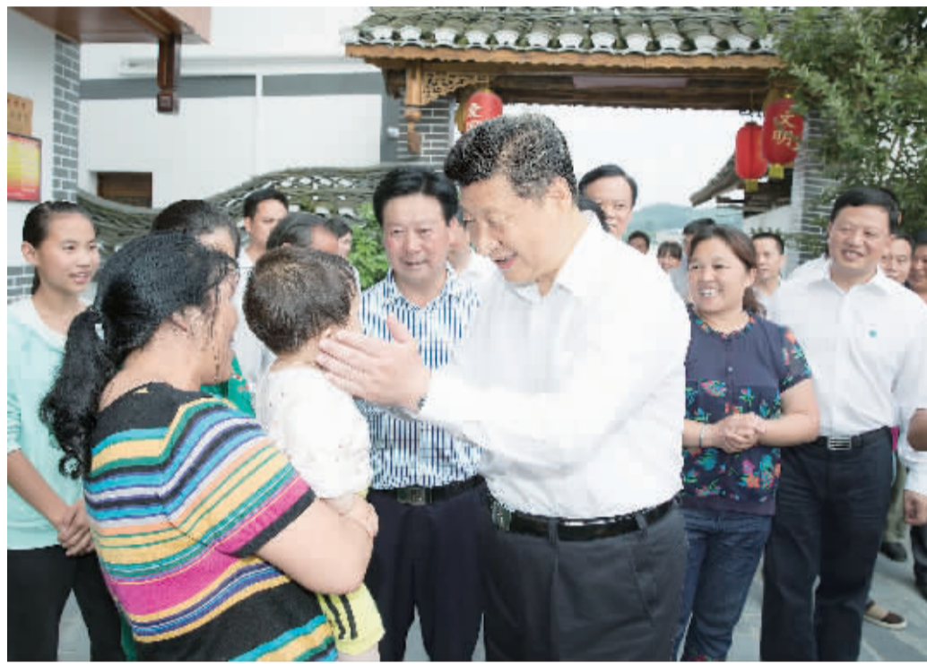
左图 6月16日至18日,中共中央总书记、国家主席、中央军委主席习近平在贵州调研。这是16日下午,习近平在参观遵义会议会址时向群众招手致意。