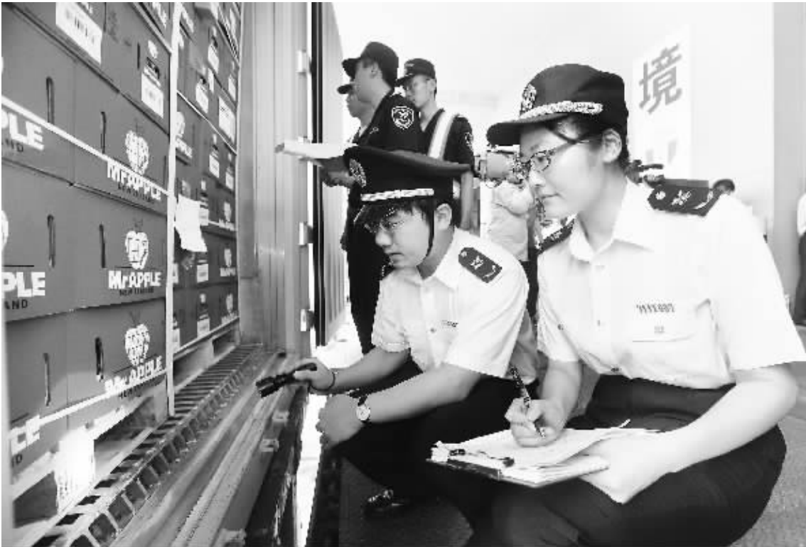
6月17日，上海海关和上海出入境检验检疫局工作人员在查验刚卸下的新西兰进口苹果。据了解，这批苹果从靠泊码头到查验后放行，全程仅需6小时。