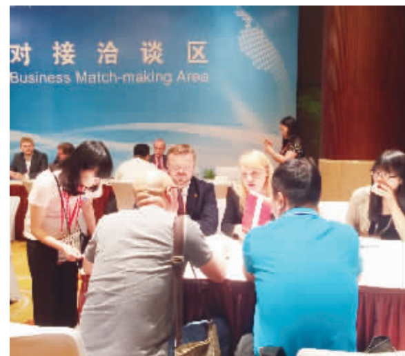
中国—中东欧国家投资洽谈会专门开辟了合作洽谈区，让中国和中东欧国家企业面对面交流合作项目。