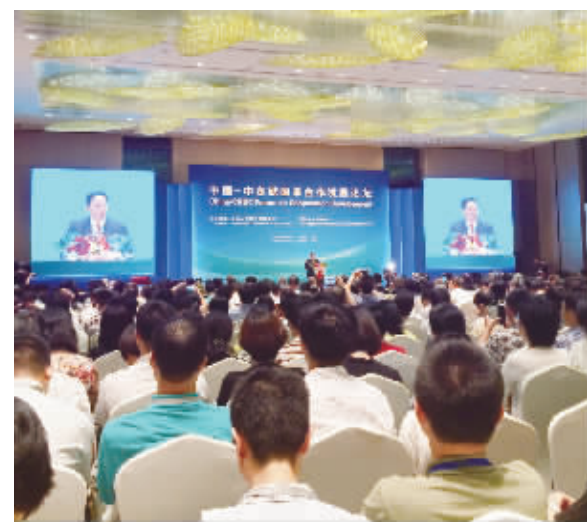
中国—中东欧国家合作发展论坛座无虚席，来自中东欧16国的政府官员和学者就“扩大合作开放，共建一带一路，促进中国与中东欧国家共同发展”这一主题展开热烈讨论。 本报记者 禹洋摄

宁波在抓紧创办工业园承接中东欧产业的同时，还主动走出去到中东欧国家兴办产业园区。目前，宁波经济技术开发区正在与波兰、慈溪市正在与保加利亚洽谈兴办宁波工业园区，让更多的宁波企业到中东欧投资办厂。宁波借力中国—中东欧国家投资贸易博览会，努力打造成为中国与中东欧国家双向投资合作的首选之地。