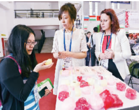
采购商在了解保加利亚手工皂。

宁波希望了解中东欧，中东欧也需要了解宁波，这是双方牵手的内在动因，也促成了首届中国—中东欧博览会放在宁波举办。正如宁波市委副书记、市长卢子跃所说：“宁波全力以赴办好首届中国—中东欧博览会，争取使其永久落户，努力把宁波打造成为中国与中东欧国家双向投资合作的首选之地、中东欧商品进入中国市场的首选之地、中国与中东欧国家人文交流的首选之地。”