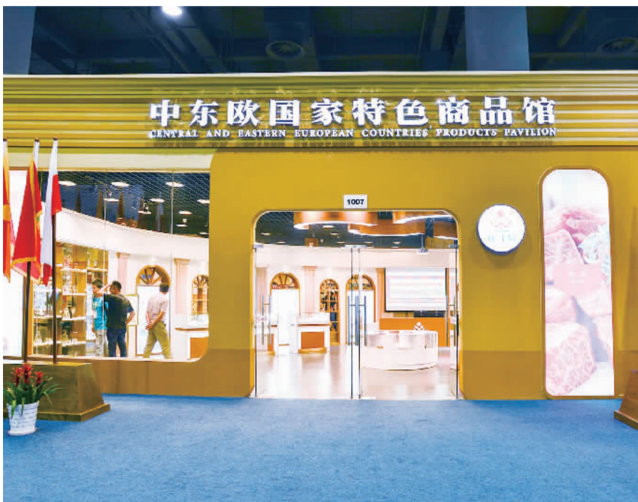
中东欧国家特色产品馆出售水晶、红酒、奶制品、饮料、副食等特色产品。

6月8日至12日，在浙江省宁波市举办的中国—中东欧国家投资贸易博览会上，来自中东欧16个国家的200多家参展商踊跃参加“中东欧特色商品展”，向中国采购商集中推销3000余种特色产品。在当前世界经济复苏缓慢、欧洲经济增长乏力的大背景下，中国—中东欧国家间贸易投资的迅速发展，将为中国和中东欧国家经济增长和对外合作注入新的动力