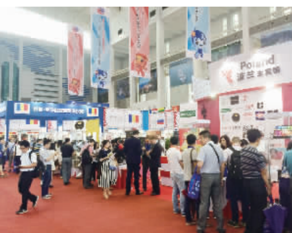
中东欧国家特色产品展吸引了来自中国各地的采购商。