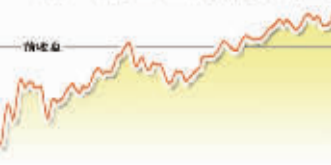
6月10日上证综指走势图