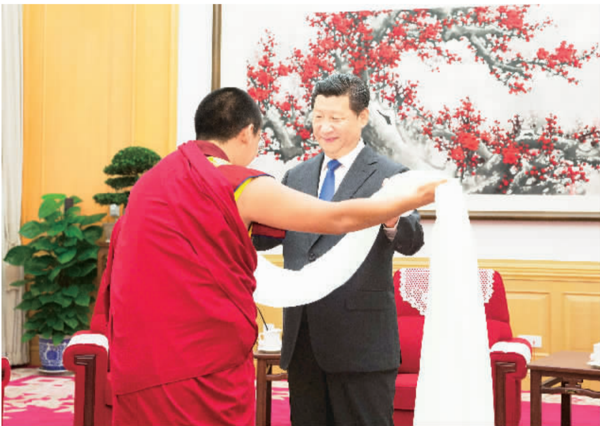
6月10日,中共中央总书记、国家主席、中央军委主席习近平在北京中南海接受班禅额尔德尼·确吉杰布的拜见。这是班禅向习近平敬献哈达。

中共中央政治局委员、中央统战部副部长孙春兰,中共中央政治局委员、中央办公厅主任栗战书参加活动。