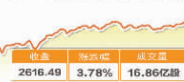
6月10日波动最大行业走势图