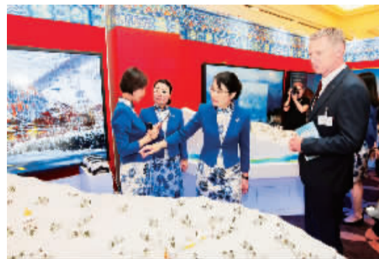
6月10日,国际奥委会工作人员在北京的展示咨询室参观。国际奥委会9日举行2022年冬奥会候选城市与国际奥委会委员之间的陈述交流会,同时要求候选城市设立展示咨询室,10日接待国际奥委会委员和全球媒体的咨询活动。

2008年,北京奥运会提出了“绿色奥运、科技奥运、人文奥运”的理念,从宏观的角度把中国、北京全面展示给了世界。“纯洁的冰雪,激情的约会”。——北京申办2022年冬奥会的理念,是对2008年北京奥运会理念的传承和细化,披上冰雪盛装的北京2022,将把其美好的另一面展示在世界面前。这样的冬奥会,一定会让运动员和参与者期待,同样也会让运动员和参与者铭记。